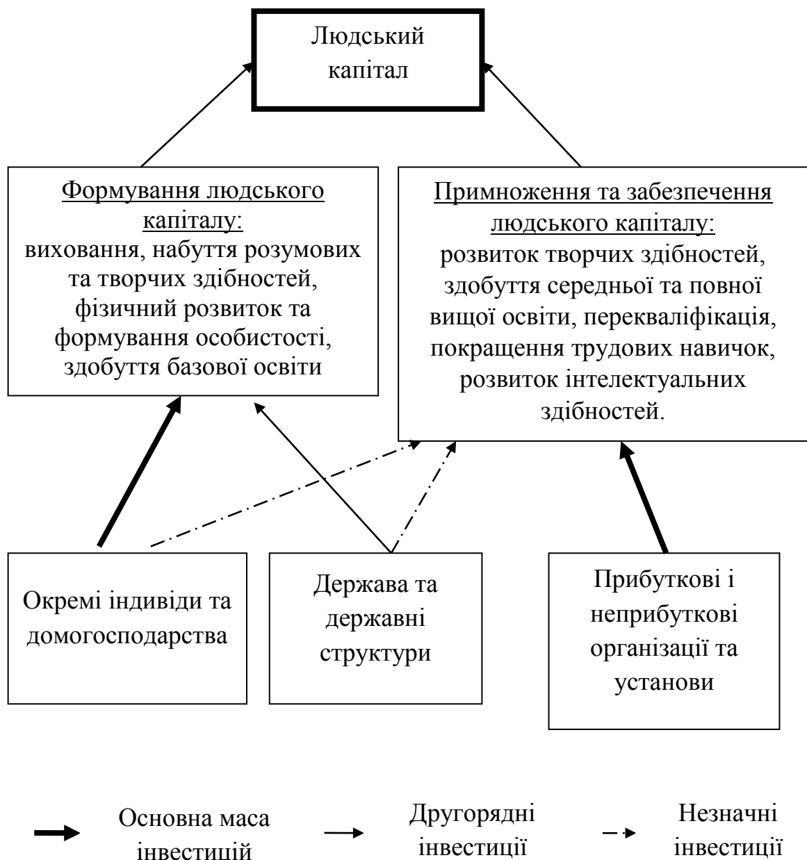
Рис. 2. Процес становлення та подальшого збагачення людського капіталу (складено на основі джерел 6, 1)

У наукових працях А. Т. Роджера, Й. Шумпетера, Д. Белла, В. Іноземцева, А. Чухна важливе місце відводиться питанням інтелектуальної складової в процесі праці, зростанню ролі знань та інформації як головного фактора виробництва в постіндустріальному суспільстві.