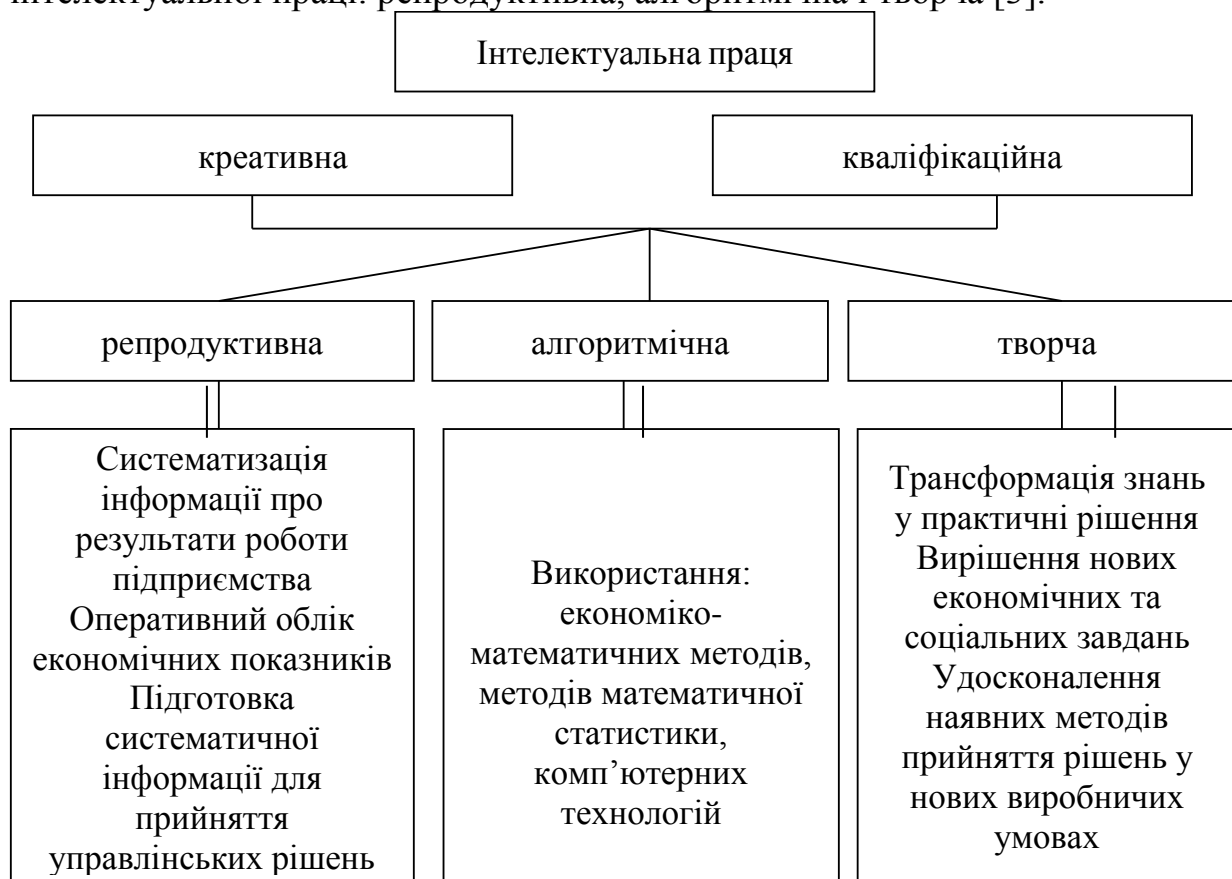
Рис. 3. Характеристика видів інтелектуальної власності

О. Кендюхов визначає інтелектуальну працю як «сутнісну основу процесу створення інтелектуального продукту і відтворення інтелектуального капіталу» і її зміст формується під впливом таких головних параметрів як міра креативності та кваліфікаційної складності, що є органічно взаємозалежними. Крім цього автор виділяє такі види інтелектуальної праці: репродуктивна, алгоритмічна і творча [3].